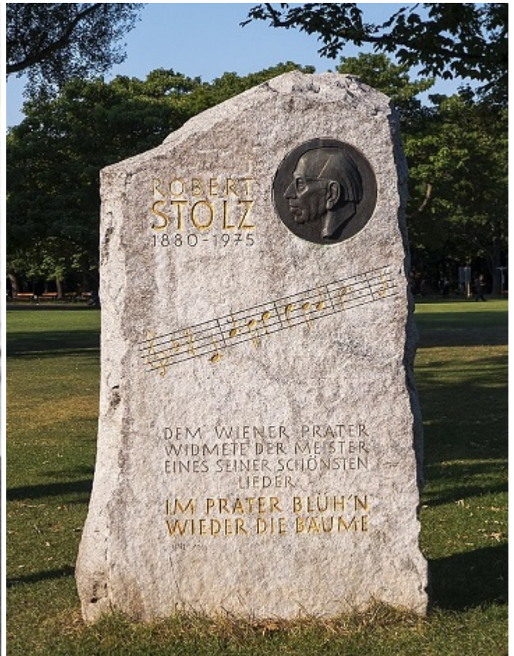
Пам'ятний камінь Штольцу у парку Пратер, Відень