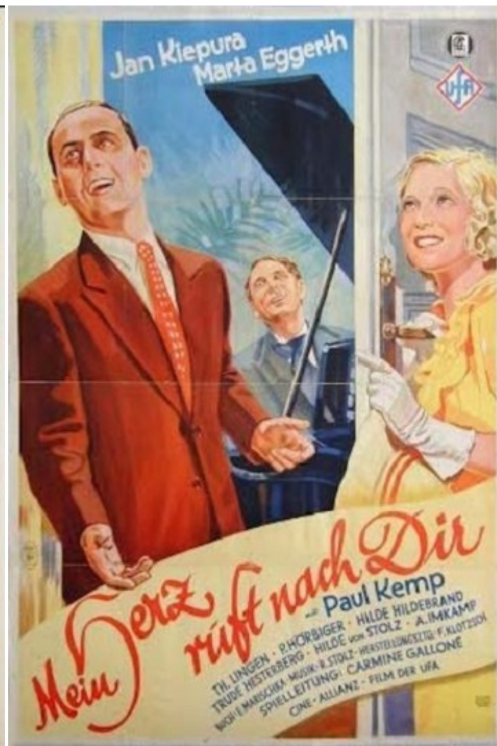
Афіші фільмів, поставлених на музику Штольца

На початку 1930-х Штольц написав музику для трьох десятків кінострічок, не припиняючи створювати виступи для кабаре і писати нові оперети.