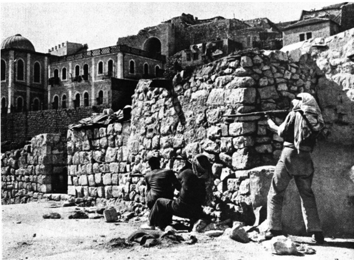
Солдати Арабського легіону обстрілюють єврейський квартал Єрусалима, 1948