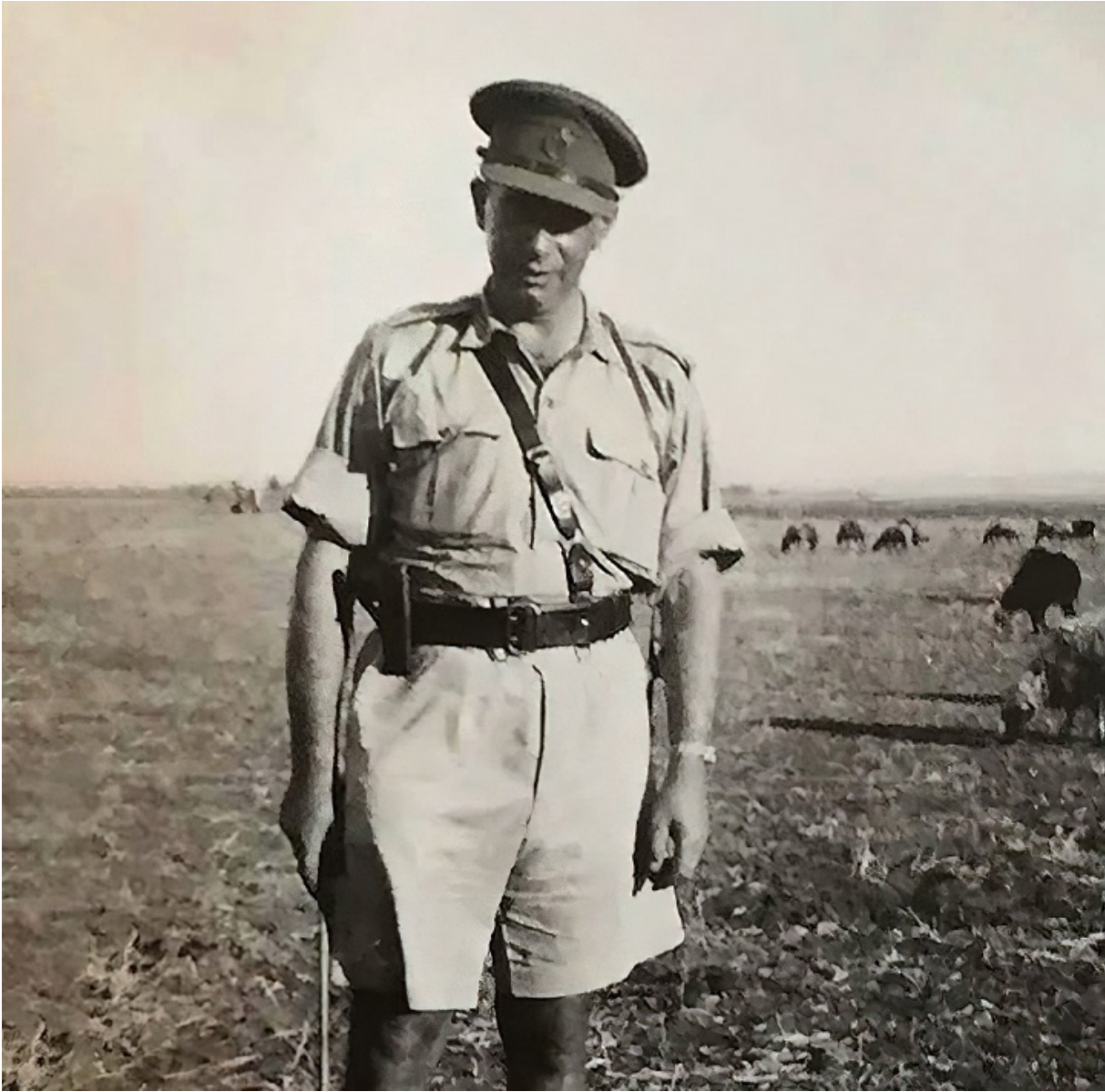
Меїр (Міша) Тувіанський

44-річний капітан Меїр (Міша) Тувіанський, розстріляний у червні 1948 року, став єдиним ізраїльтянином, щодо якого було приведено у виконання смертний вирок. Арешт був неправомірним, звинувачення в державній зраді неправдиві, але швидкий суд і неможливість оскаржити вирок не залишили капітану шансу.