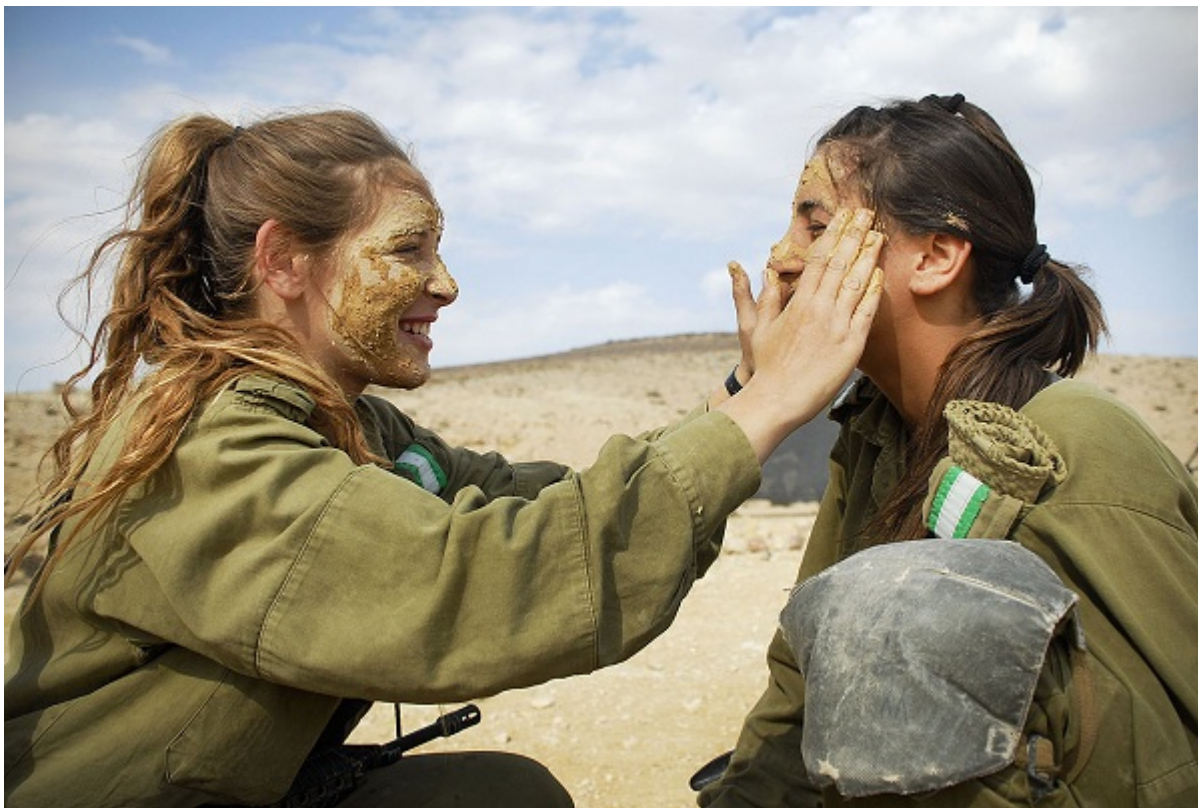
Девушки-солдатки готовятся к учениям

Но почему не наблюдается аналогичная картина среди женщин? То, что процент призыва женщин почти не изменился, указывает на положительную тенденцию. Видимо, женщины из национально-религиозного лагеря стали чаще отказываться от альтернативной службы в пользу действительной службы в ЦАХАЛе.